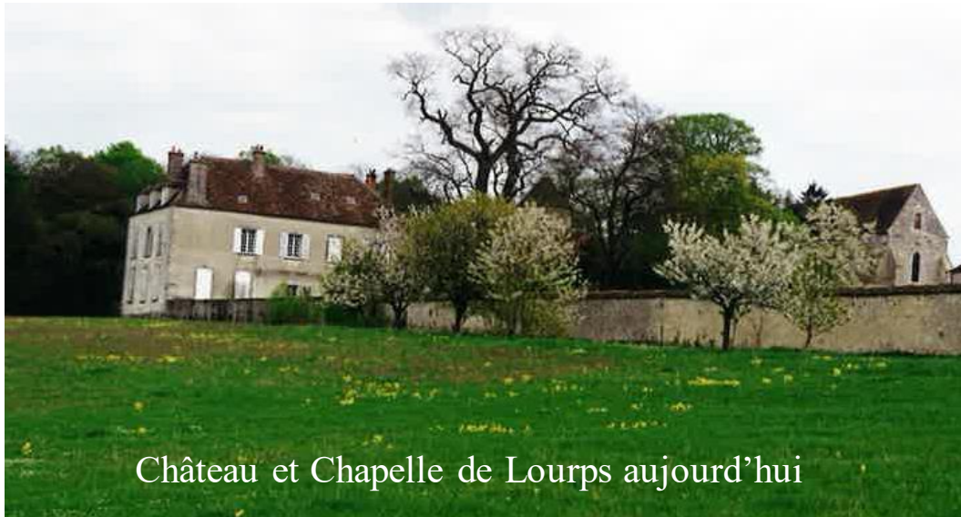
Château et Chapelle de Lourps aujourd'hui

Samedi 30 octobre 2021 « Huysmans à Lourps »